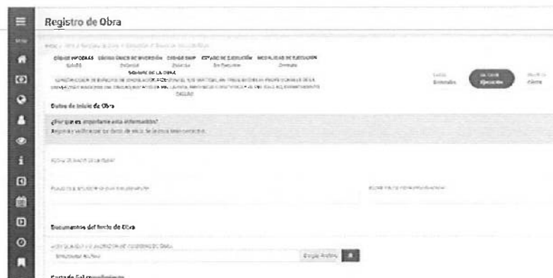
Imagen n°03- Información en Infobras