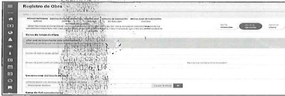
Imagen n°03- Información en Infobrás

"Año de la Esperanza y el Fortalecimiento de la Democracia"