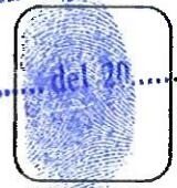
Huella digital (Indice Derecho)

Adjunto: Declaraciones Juradas, Copia del DNI, Copias de Grados y Títulos Académicos